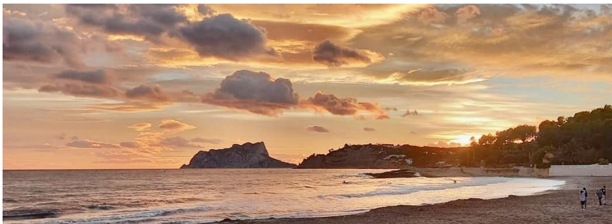
Platja de l'Andrago